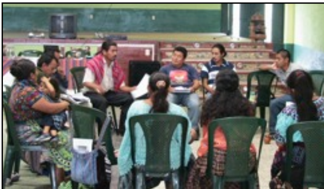
Taller de CITI sobre los Indicadores Culturales, Chimaltenango, Guatemala, Junio de 2008.

Los Pueblos Indígenas en asociación con la Organización de las Naciones Unidas para la Agricultura y la Alimentación (FAO) elaboraron los Indicadores Culturales para la Soberanía Alimentaria, Seguridad Alimentaria y Desarrollo Sostenible en la 2da Consulta Global sobre el Derecho a la Alimentación y Seguridad Alimentaria para Pueblos Indígenas en Bilwi, Nicaragua (2006). Los indicadores representan una herramienta práctica para las comunidades indígenas para evaluar los puntos fuertes, tendencias y amenazas actuales, lo que incluye las prácticas culturales tradicionales, los conocimientos y las relaciones con respecto a los sistemas de alimentación tradicional y para elaborar estrategias eficaces para defender, proteger y restaurar sus Soberanía Alimentaria. CITI realiza talleres sobre el uso de los Indicadores Culturales en diversas comunidades indígenas.